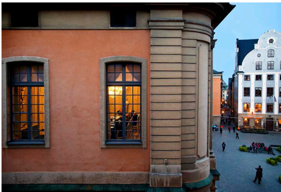
Svenska Akademien har sina lokaler i Börshuset vid Stortorget i Gamla stan.