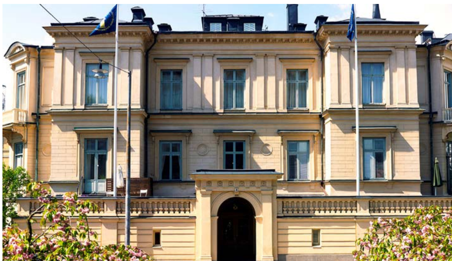
Kungl. Vitterhetsakademiens hus (Rettigska huset).