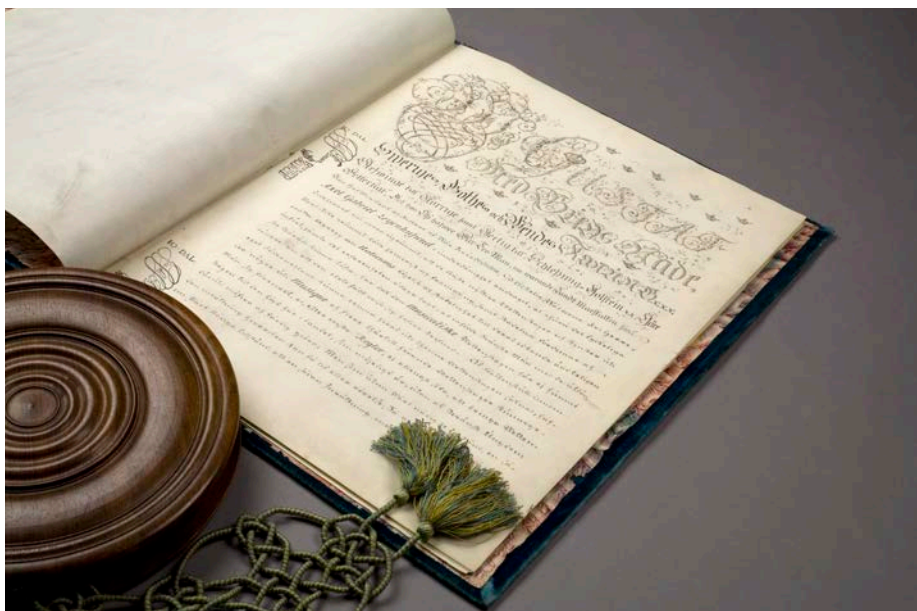
Första sidan av KMA:s instiftelsebrev från den 8 september 1771.