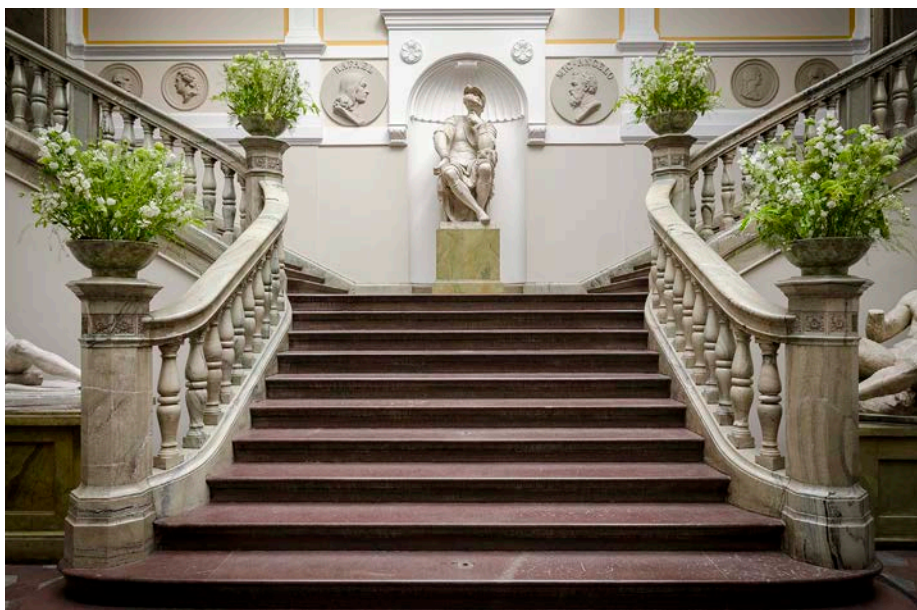
Konstakademien, Nikehallen.