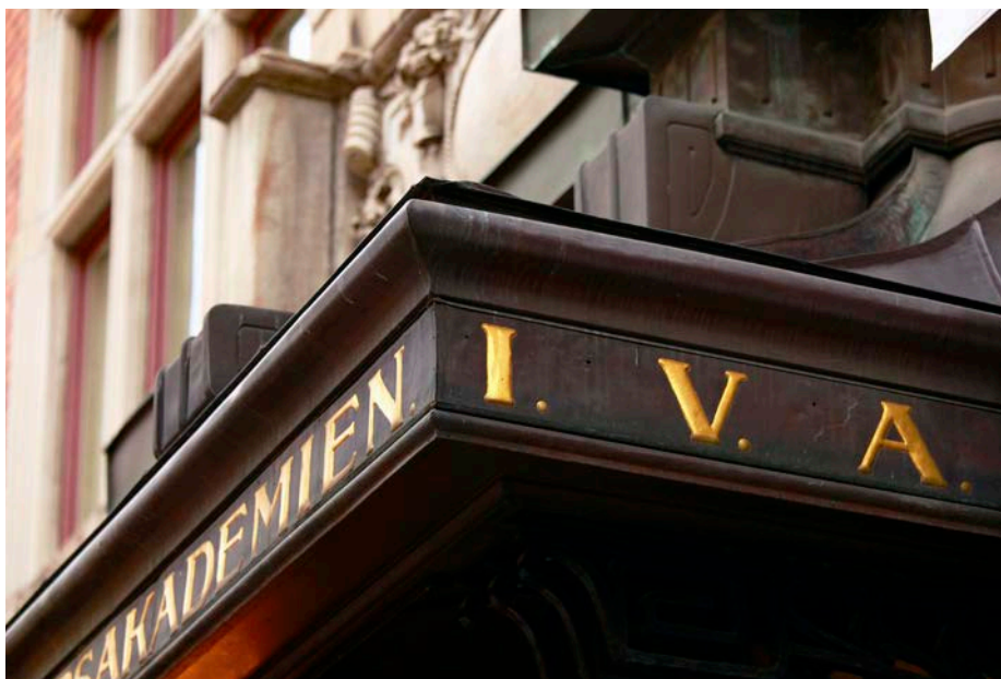
Entrén på Grev Turegatan där IVA huserar sedan grundandet 1919.