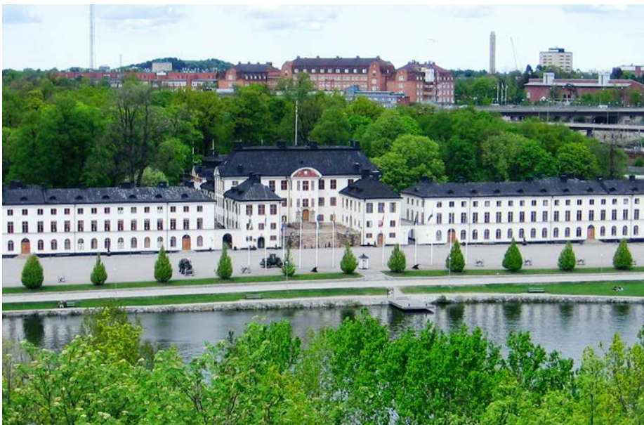
Här på Karlbergs slott och den dåvarande krigsskolan för armén och flottan, som inrättades 1792, föddes idén till att bilda en krigsvetenskaplig akademi.