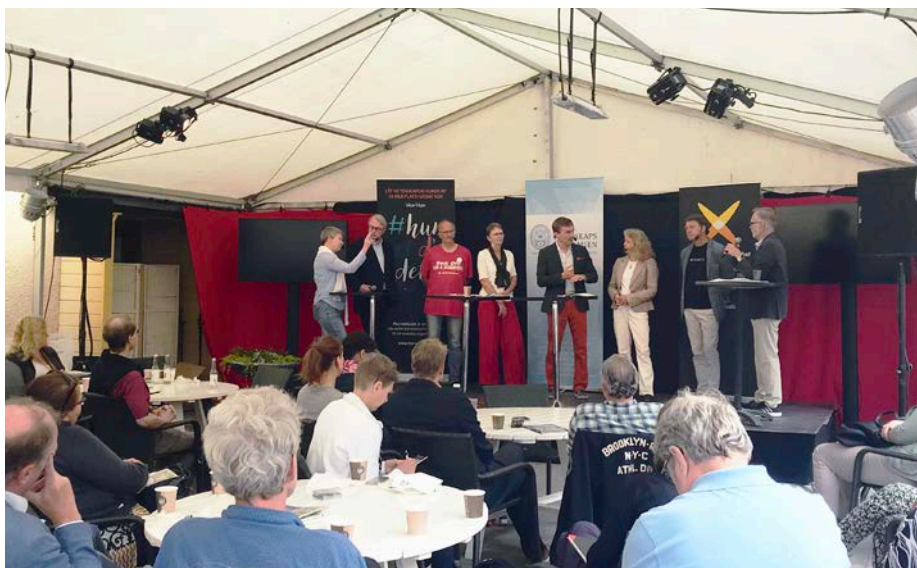
Almedalsseminarier är en av många utåtriktade aktiviteter i akademiens arbete med att stärka vetenskapernas inflytande i samhället.