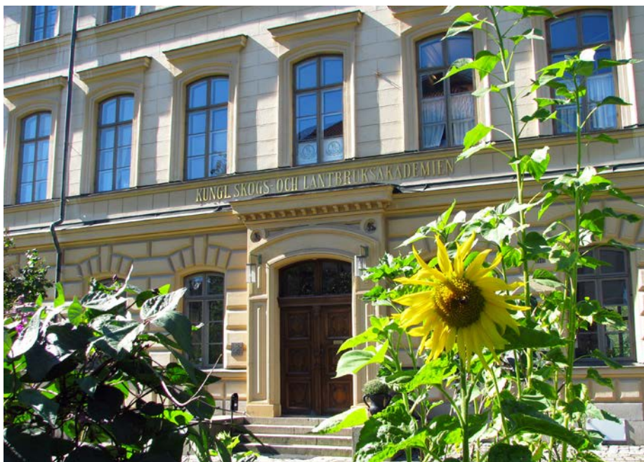
KSLA:s fastighet vid Drottninggatan 95 B i Stockholm.